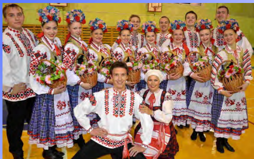
Народный фольклорно-хореографический ансамбль «Радимичи» (Скакун М.А.)

7 коллективов университета имеют почетное звание «Народный»