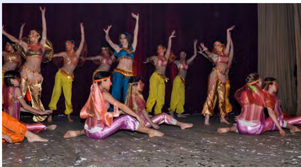
Международная студенческая встреча «Беларусь – страна мира и согласия!»