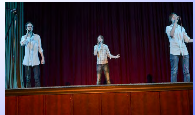
Солисты студенческого клуба (Старосельцева А.М.)