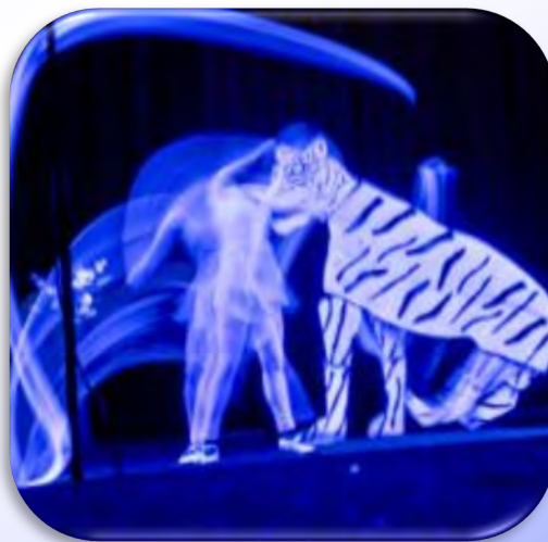
Гала-концерт для студентов 1-го курса