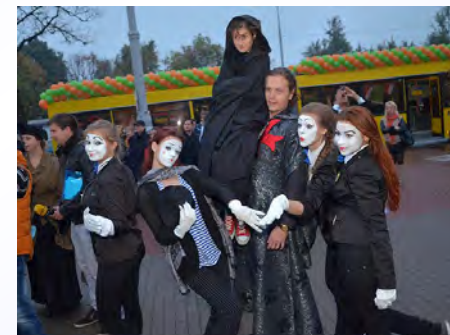
Народный студенческий театр-студия «Если бы...» (Зеньков С.Н.)