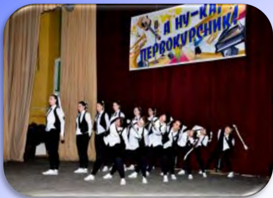
«А ну-ка, первокурсник!»

Студенческим клубом университета организовано и проведено 30-ть общеуниверситетских мероприятий и заработано более 123 000 000 белорусских рублей