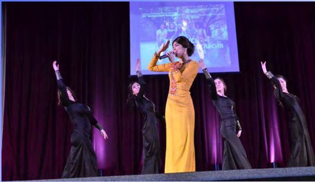
День нейтралитета в Туркменистане