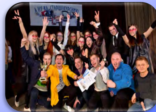
«А ну-ка, старшекурсник!»