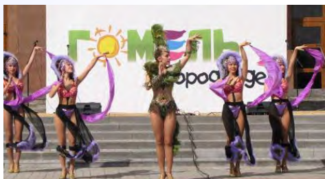
Народный театр танца «Коктейль» (Сорока И.В.)